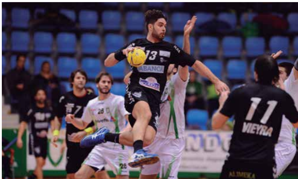
Domingo 20 de diciembre. XXVI Copa Asobal Final.